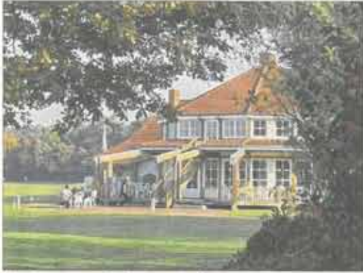
Umgeben von weiten Grünflächen und in Kürze auch wieder von Laub tragenden Bäumen liegt das Clubhaus idyllisch da.