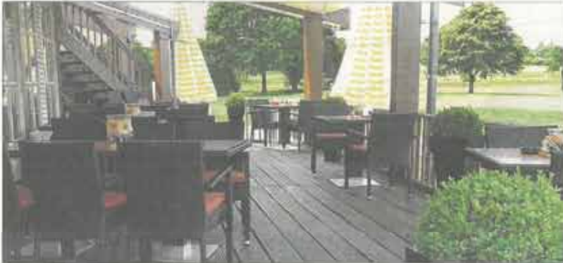
Von der Terrasse des Golf-Restaurants haben Gäste einen herrlichen Blick über die Golfanlage. Die Brasserie zieht übrigens nicht nur Freunde des grünen Sports an.

Inneneinrichtungen verbinden Handwerkskunst mit Kreativität / Simone Carrell bei Neueröffnung dabei