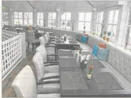
Der Innenbereich auf zwei Etagen ist komplett neu eingerichtet und lädt Gäste zum Verweilen ein.