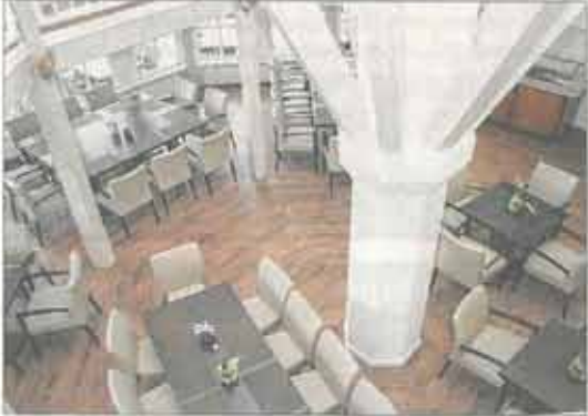
Beim Blick von oben kann man sich einen Eindruck vom Resultat der Umbaumaßnahmen verschaffen.