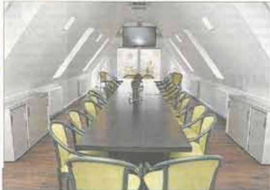
Die Rudi-Carrell-Lounge bietet sich für Familienfeiern sowie für geschäftliche Meetings an.

Vom Scheitel bis zur Sohle sollte das Clubhaus der Golfanlage in Syke nach 20 Jahren erneuert und verschönert werden. Dieses Projekt ist gelungen. Seit der Neueröffnung am vergangenen Wochenende erstrahlen die Räumlichkeiten in neuem Glanz. Zur Erinnerung an das prominente Ehrenmitglied, Showmasterlegende Rudi Carrell, wurde zudem eine Lounge eingerichtet.